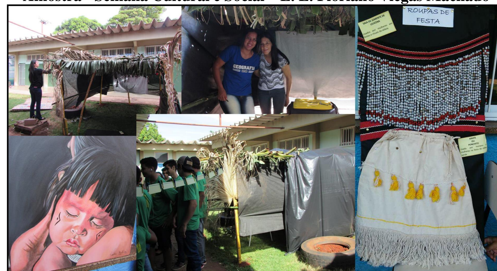
Amostra - Semana Cultural e Social – E. E. Floriano Viegas Machado

Fonte: Fonte: Fotos Lucilene Plens, 2014. Organização Cardoso (2018).