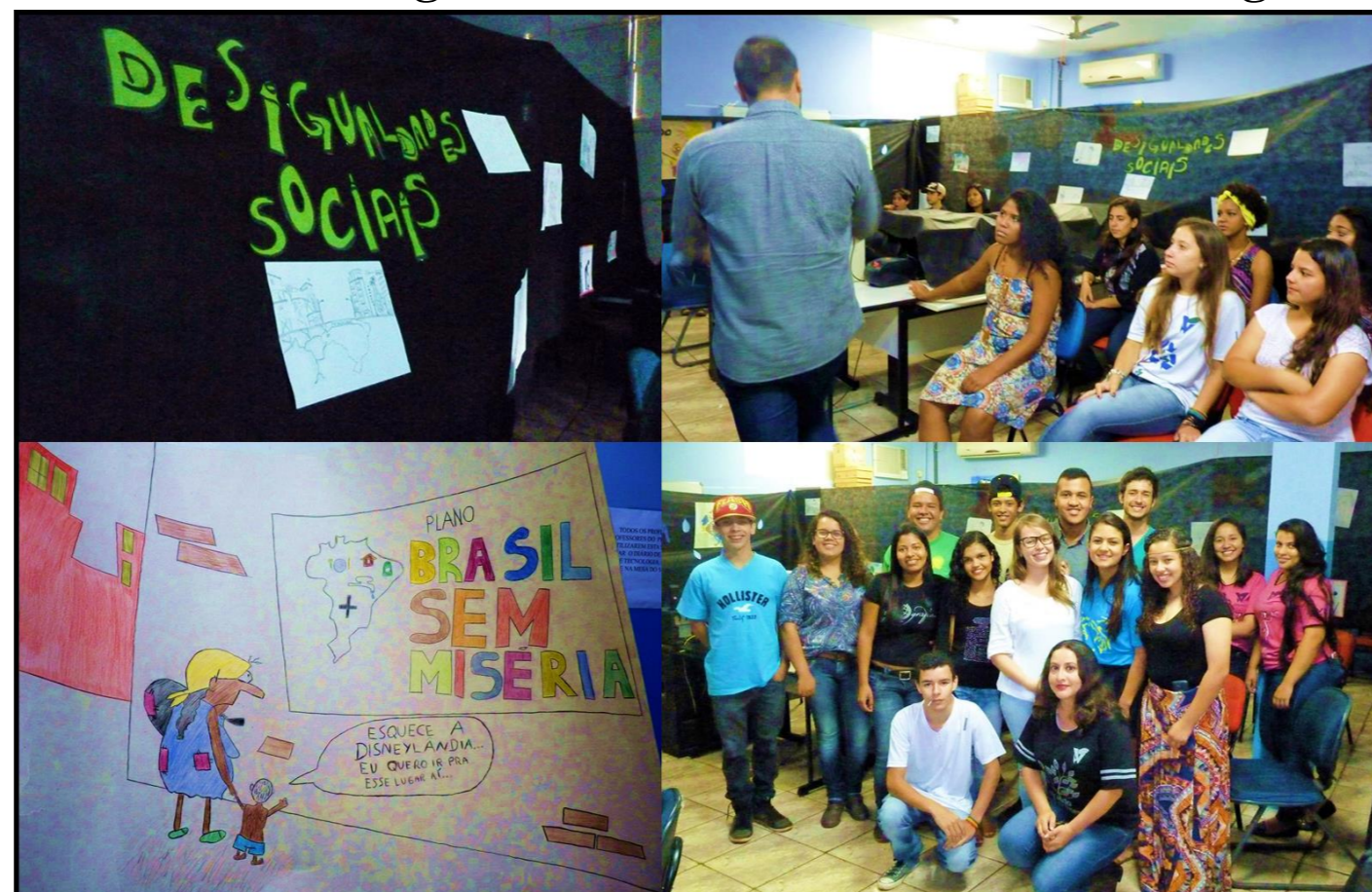
Amostra - Desigualdades Sociais - E. E. Floriano Viegas

Fonte: Trabalho de Campo, 2018. Fotos Silvana de Abreu, 2015. Organização Cardoso (2018).