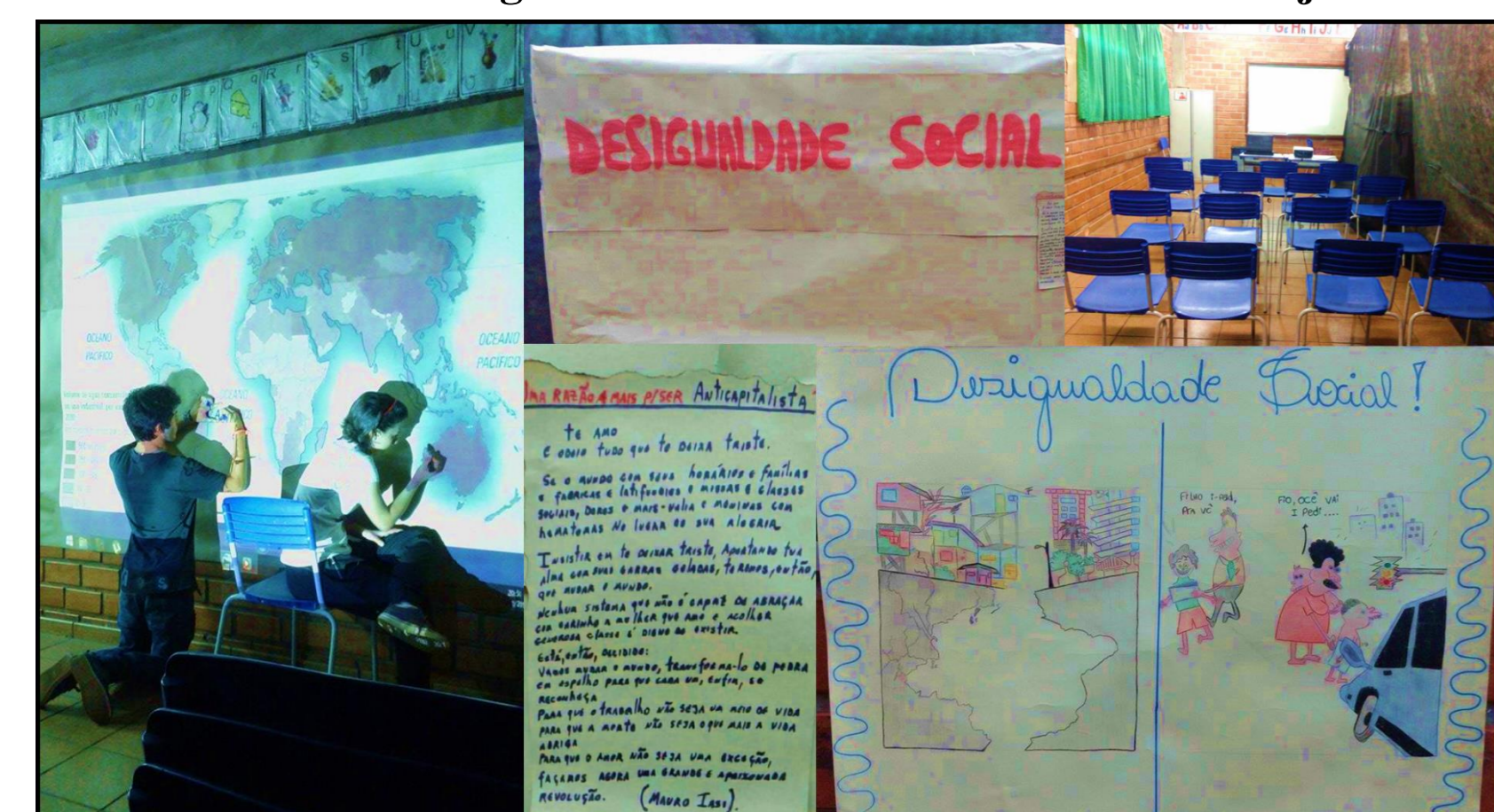
Amostra - Desigualdades Sociais – E. E. Alício de Araújo

Fonte: Trabalho de Campo, 2018. Fotos Silvana de Abreu, 2015. Organização Cardoso (2018).